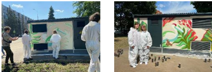
Рисунок 2. Этапы работы над проектом

Реализация проекта и его презентация началась с перенесения эскизов на объекты в формате 3D-моделей. Согласовав их с АО «ОЭК», участники приступили к перенесению их на трансформаторные подстанции (рис. 2). Вся работа над проектом контролировалась специалистами из АО «ОЭК».